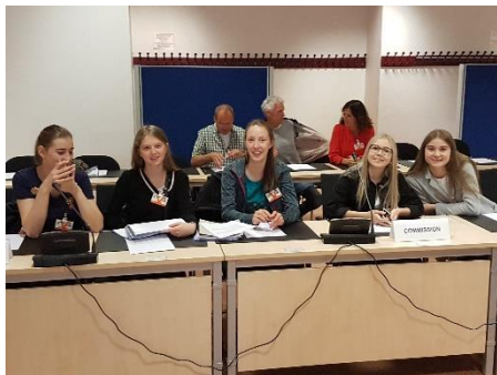
Bilder von der EU-Projektreise der 6. Klassen Frankfurt und Brüssel